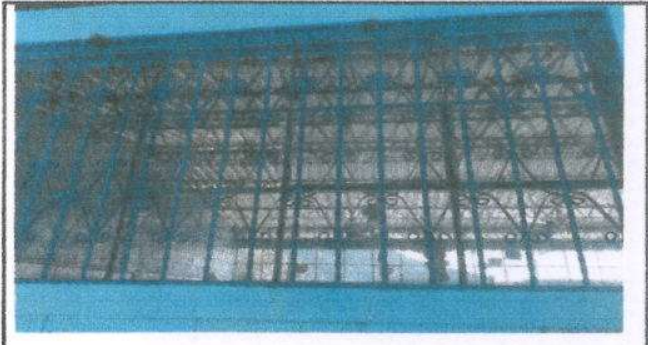
Foto 4: Fabricación e instalación de balcones de hierro en ventana