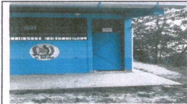
Foto1: Mantenimiento a estructura (lijado, cambio de tubo , cepillado, sujeciones, aplicación de pintura)